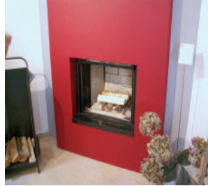
Şöminelerde Yemek ocaklarında