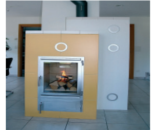
Isı biriktiren sobalar Çinili sobalar Lardit sobala