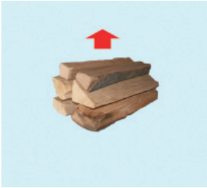
Gazları yukarıya doğru çıkan parça odun ateşlerinde