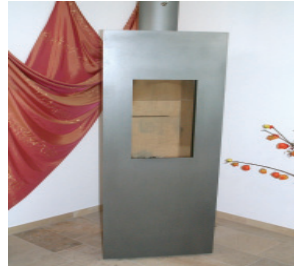
Şömine tipi sobalarda